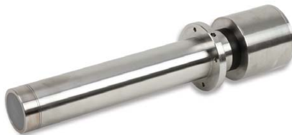
Рис 3 : Hydro-Probe SE

Значительное преимущество использования прокалиброванных на заводе-изготовителе датчиков заключается в том, что в случае замены или временного снятия датчика для технического обслуживания можно установить сменное устройство и загрузить в него данные калибровки из предыдущего датчика.